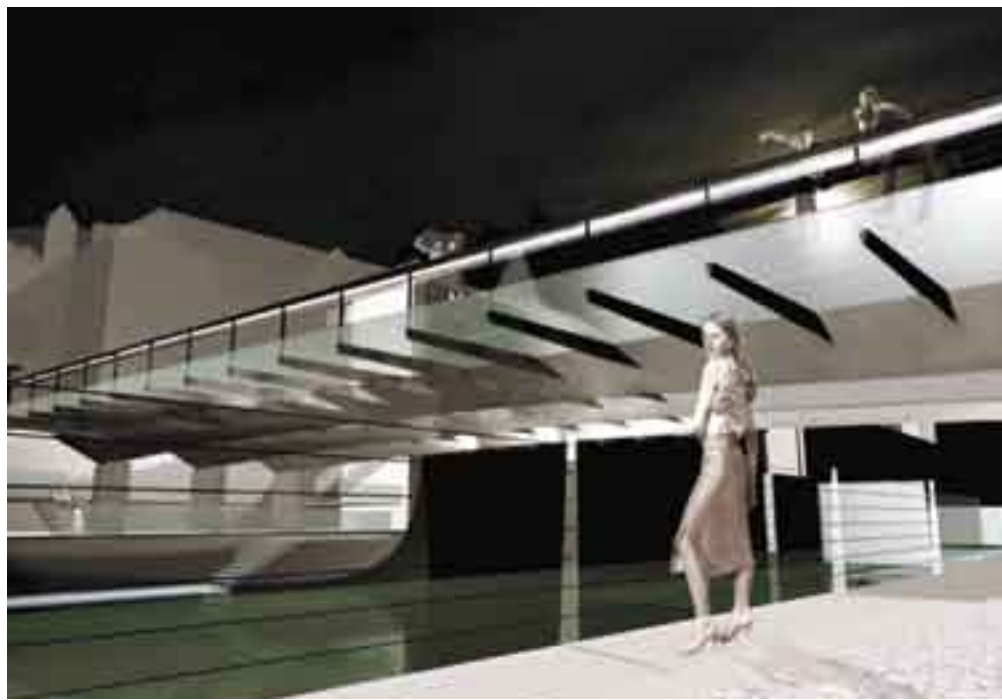
Atelier arhitekti: zmagovalni projekt republiškega natečaja za Mesarski most v Ljubljani, 2008