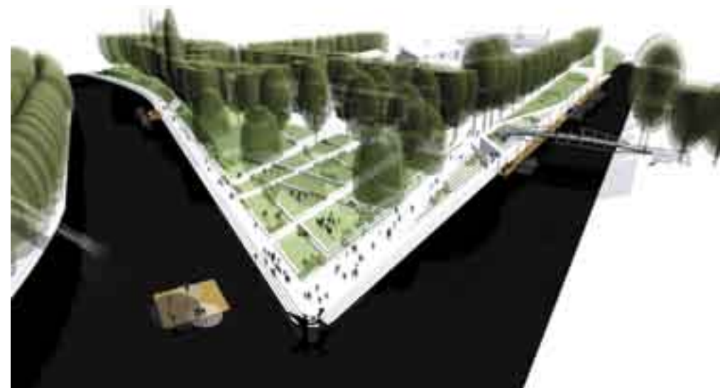
Atelier arhitekti: natečajni projekt ureditve ljubljanske Špice