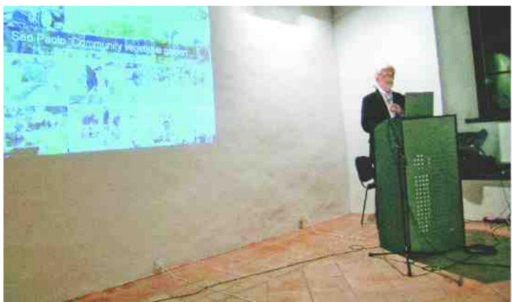
PREDAVANJE OBlikovalca EZIA MANZINIA V ARHITEKTURNEM MUZEJU