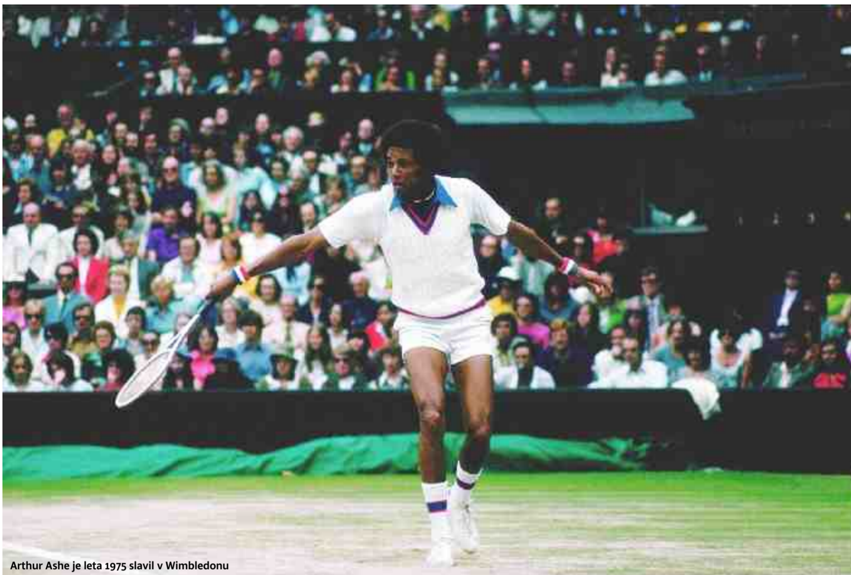
Arthur Ashe je leta 1975 slavil v Wimbledonu